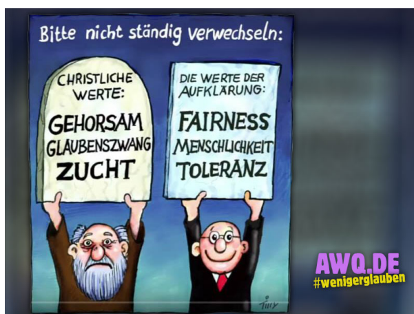
Cartoon (c) J. Tilly

Die Kirche leitet uns auch zu Tugenden wie Wahrheit, Gerechtigkeit, Toleranz und Frieden an. Werte, ohne die eine freiheitliche Ordnung nicht bestehen kann.