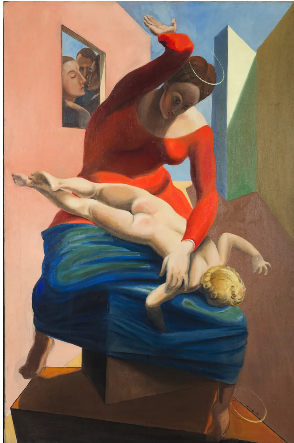
RBA Ernst, Max; La vierge corrigéant l'enfant Jésus devant trois témoins: André Breton, Paul Éluard et le peintre, Museum Ludwig (ML 10056, Köln)

(Foto: © Rheinisches Bildarchiv Köln, Walz, Sabrina, rba_d048643_01) https://museum-ludwig.kulturelles-erbe-koeln.de/documents/obj/05020089