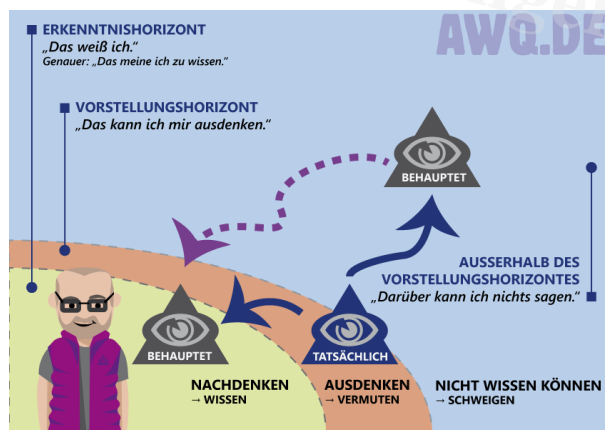
Gott auf der Erkenntnislandkarte.

Denn irgendwie müssen Gläubige ihren Gott ja jetzt noch in ihre natürliche Wirklichkeit bekommen. Vor den Erkenntnishorizont. Und so wenden sie ihrerseits ein ganzes Arsenal an Werkzeugen an, mit denen sie versuchen, ihren Gott doch irgendwie auf der Erkenntnislandkarte unterzubringen: